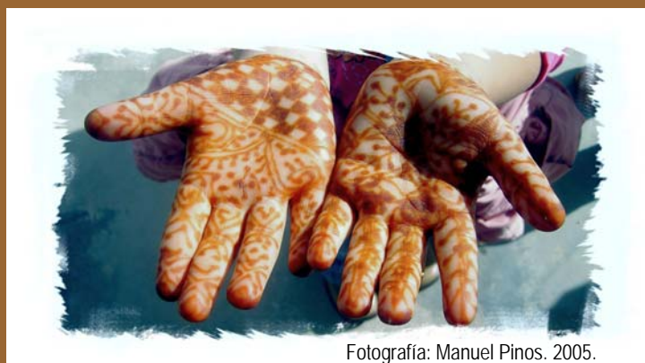
Fotografía: Manuel Pinos. 2005.